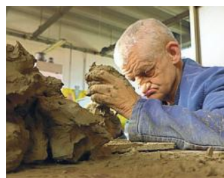
LAZZATI - 600 EURO Uno dei "Volto della Sacra Famiglia" ritratti da Margherita Lazzati, stan della Fondazione Sacra Famiglia