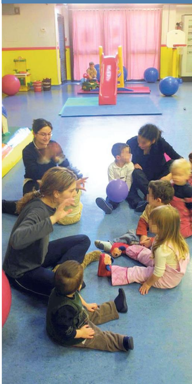
Il bonus nidi sarà sperimentato fino al mese di luglio 2017