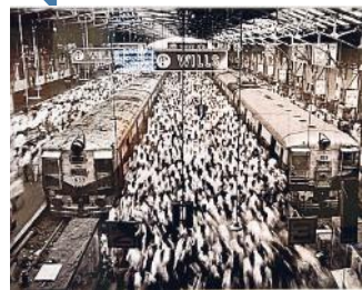
SALGADO - 23.000 EURO Sebastião Salgado, "India", 1993, la fotografia è esposta nello stand dell'agenzia Contrasto