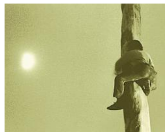
DONDERO - 1800 EURO Mario Dondero, "L'uomo che voleva raggiungere la luna" 1993, galleria Ceribelli, Bergamo