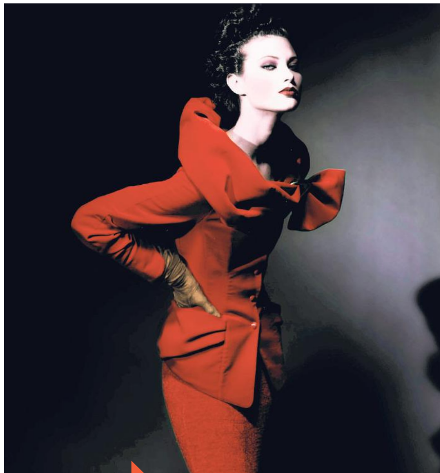
GASTEL - 6.500 EURO Giovanni Gastel, "Untitled (Shalom)", 1992, galleria Photo & Contemporary Torino Le opere di Gastel nelle fiere partono da 6500 euro

Consigli per gli acquisti tra gli oltre cento stand: vanno forte i ritratti delle dive, da Sofia Loren a Bianca Balti