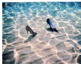
ZINK - 4.400 EURO Marko Zink, fotografo austriaco: l'opera intitolata "Schwimmer", del 2005, è alla galleria Michaela Stock, Vienna