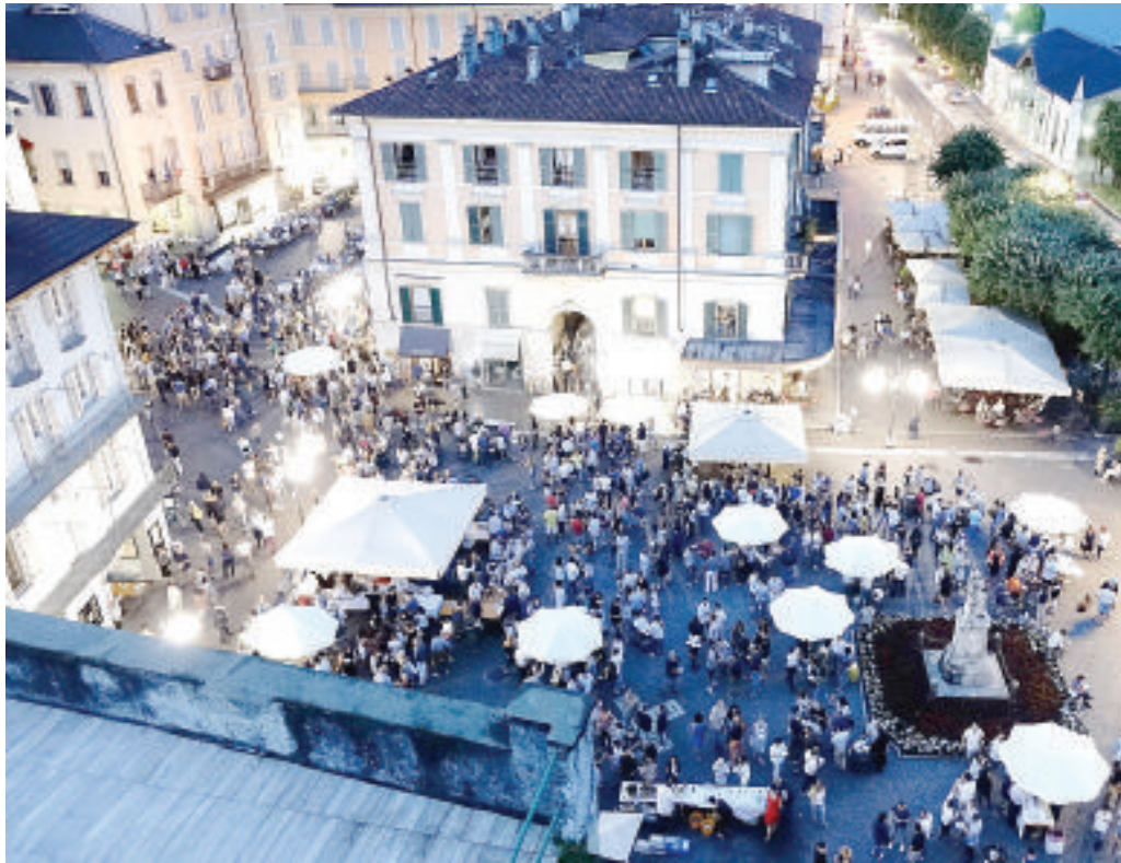
Venerdì in piazza Ranzoni a Intra a partire dalle 19 è in programma Gustabile